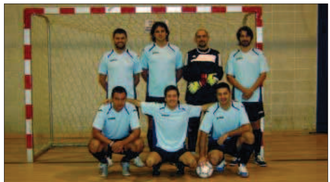
Equipo de Espaicentonze

La clasificación del campeonato queda como indicamos en el siguiente cuadro: