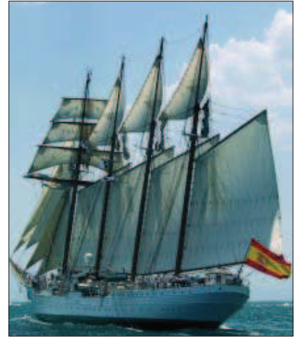
El viaje durará un mes

El buque-escuela «Juan Sebastián Elcano» partió de Marín (Pontevedra) para desarrollar un proyecto piloto en el que además de formar a futuros suboficiales impartirá clases a alumnos de la escala de tropa y marinería en un crucero de instrucción. Durante un mes, 8 aspirantes a cabo primero y 30 aspirantes a cabo de la especialidad de maniobra y navegación, que están cursando sus estudios en la Escuela de Especialidades Fundamentales de La Graña, ubicada en El Ferrol, realizarán un viaje de adiestramiento con el objetivo de completar su formación teórico-práctica. También subirán a bordo 69 guardamueles de cuarto curso.