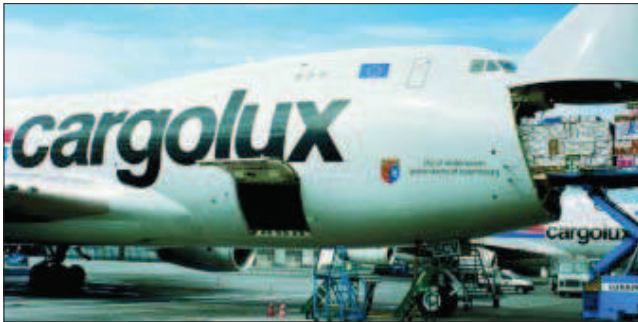
Qatar Airways disponía del 35% de acciones de la aerolínea carguera

Cargolux Airlines acaba de anunciar que el Estado de Luxemburgo ha adquirido el 35% de sus acciones que hasta este momento pertenecía a Qatar Airways. De esta forma, el accionariado de Cargolux queda como sigue: Luxair (43,4%), Estado de Luxemburgo (35%), Banque el Caisse d'Epargne de l'Etat - BCEE- (10,9%) y Société Nationale de Crédit et d'Investissement -SNCI- (10,7%).