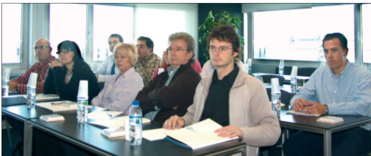
Asistentes a la primera sesión informativa para las empresas no usuarias de Portic

Portic inició el jueves 13 de noviembre sus almuerzos de trabajo para transitarios y agentes de aduanas que no son usuarios de la plataforma telemática del puerto de Barcelona, que tienen como propósito presentar su nueva aplicación Portic