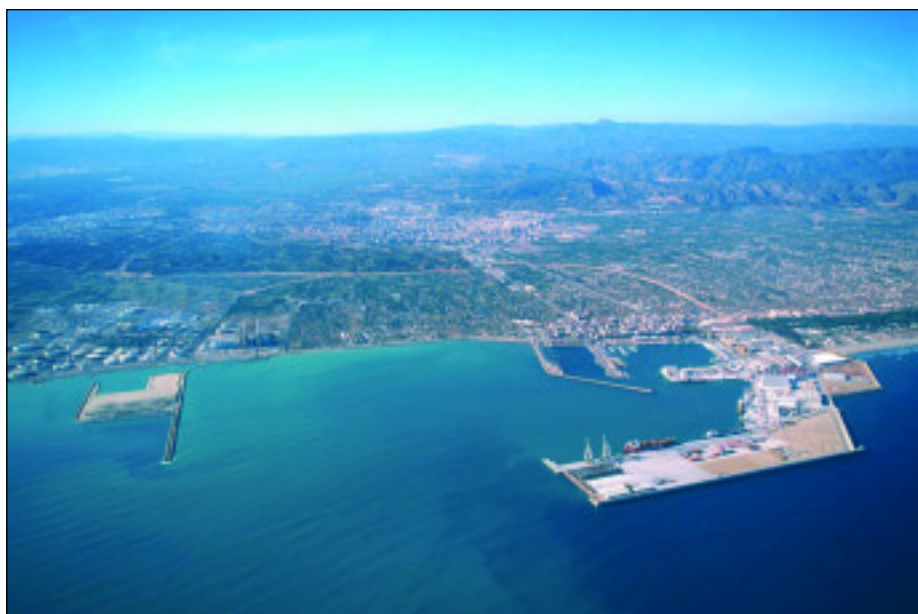
El tráfico total de mercancías del puerto de Castellón superó los 4,4 millones de toneladas (+5,9%) desde enero a abril

El tráfico de contenedores del puerto de Castellón creció un 77,49% en el primer cuatrimestre del presente año en comparación con el mismo periodo del pasado año.