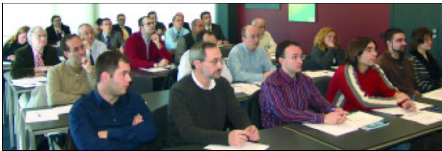
Portic organizó ayer dos sesiones informativas sobre su nueva herramienta