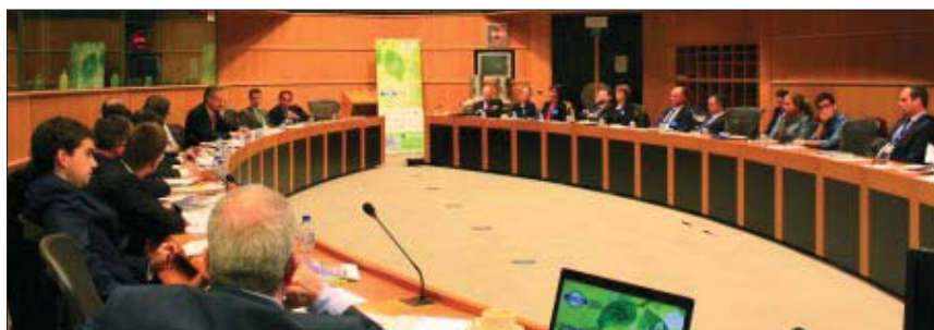
Los resultados del eje Lyon-Madrid del Corredor Mediterráneo fueron expuestos en Bruselas