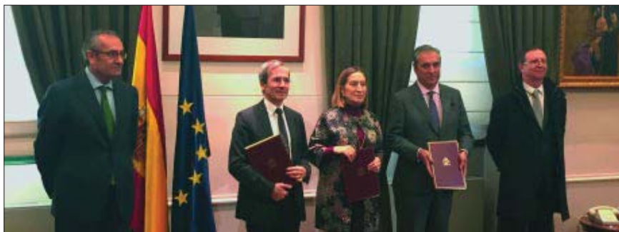
Instantánea de la firma