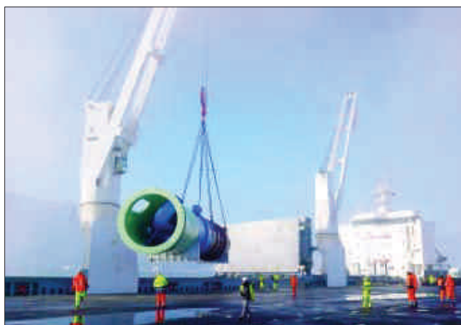
Carga de las piezas en Bilbao a bordo del «Alina»

El buque «Alina» recaló en los puertos de Bilbao y Avilés para cargar ocho grandes piezas, un total de 1.295 toneladas, con destino a Singapur. El buque fue representado en ambos puertos por Marítima Davila Bilbao, especializado en grandes cargas y proyectos industriales sobredimensionados, actuando como estibadoras las firmas Toro y Betolaza en Bilbao, y Marítima Del Principado, en Avilés.