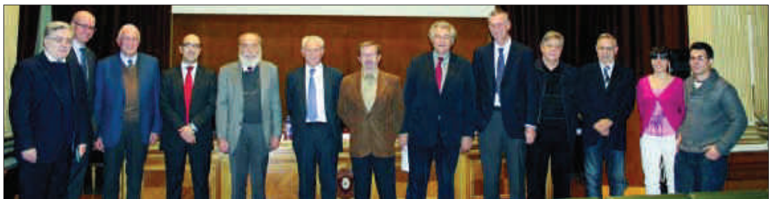
La mesa redonda sobre el acuerdo internacional de los derechos de los marinos tuvo lugar en la Facultat de Nàutica de Barcelona

El Convenio de Trabajo Marítimo 2006, ratificado por 30 países que representan el 33% del tonelaje de buques mundial, es considerado el mayor logro en la historia de los derechos de los marinos y se le ha denominado también el cuarto pilar de la normativa internacional, junto a los convenios SOLAS, STCW y